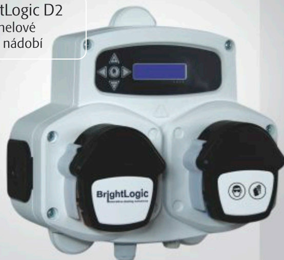
BrightLogic D2 pro tunelové myčky nádobí