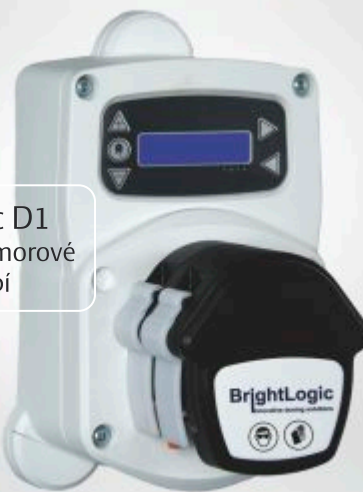
BrightLogic D1 pro jednokomorové myčky nádobí